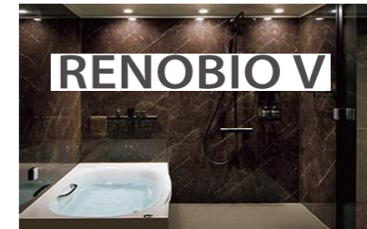
(マンション) リノビオ