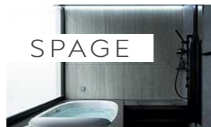
(戸建・マンション) スパーージュ